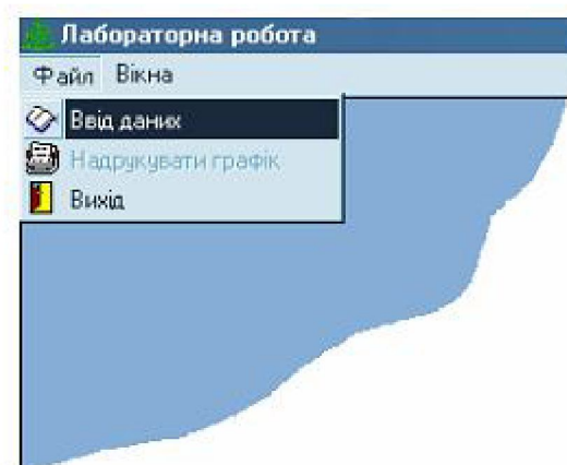
Рис. 1. Меню програми лабораторної роботи

Меню програми лабораторної роботи містить два пункти : «Файл» та «Вікна». Якщо обрати пункт меню «Файл», то на екрані з'явиться випадаюче підменю, таке як показано на рис. 1.