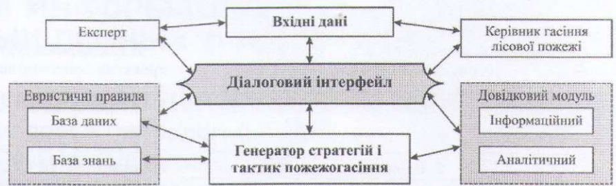
Рис. 1. Загальна структура інформаційної СППР при проектно-орієнтованому управлінні процесом ліквідації лісової пожежі

Використання сучасних інформаційних СППР дає змогу швидко обґрунтувати, а часто й оптимізувати прийняті проектні рішення при управлінні процесом гасіння лісових пожеж з врахуванням усіх особливостей перебігу оперативної обстановки і різноманіття ситуацій, які трапляються в практичній діяльності.