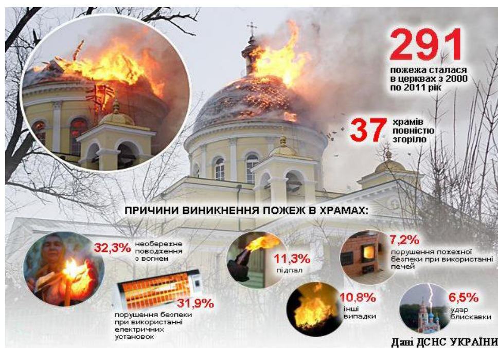
Рис. 2. Статистика пожеж у храмах України

На рисунку 2 наведена статистика найпоширеніших причин пожеж в храмах України за даними Державної служби України з надзвичайних ситуацій (ДСНС) [9].