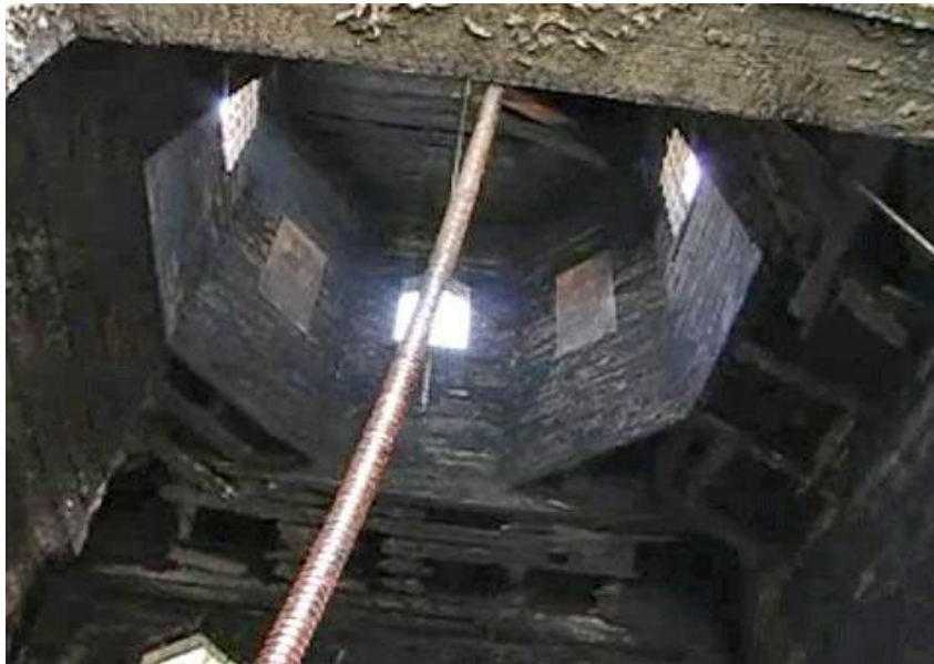
Рис. 3. Інтер'єр церкви після пожежі

Наслідки пожежі дерев'яної церкви з необробленою деревиною купольної частини Преподобної Параскеви в селі Климашівці на Хмельниччині, вік якої становив 227 років показано на рисунку 3.