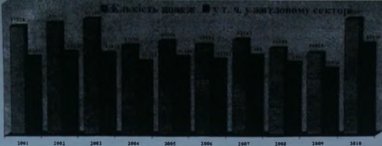
Рис. 2. Динаміка кількості пожеж за 2001 – 2010 роки